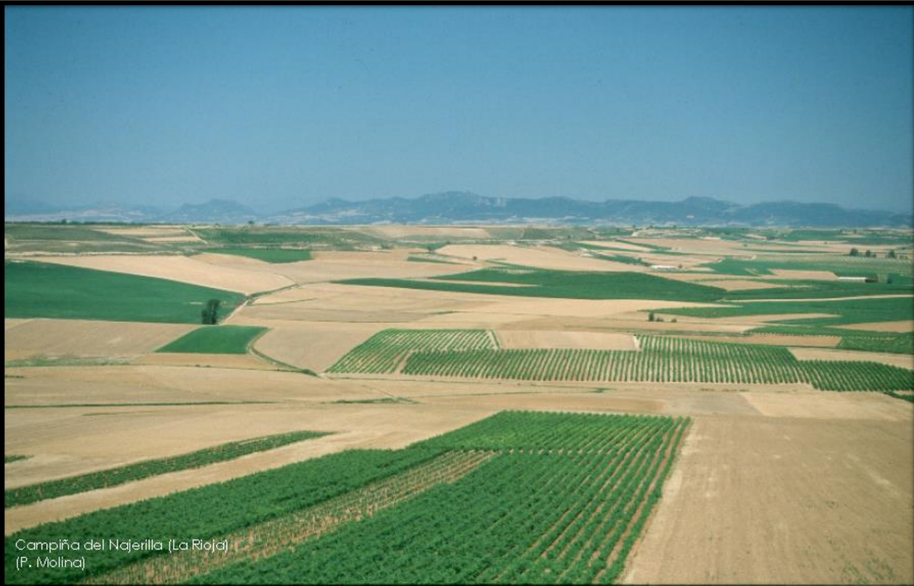
Campiña del Nájera (La Rioja) (P. Molina)